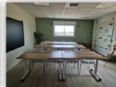
Seconde salle de 33m 2 12 personnes assises \pm 5