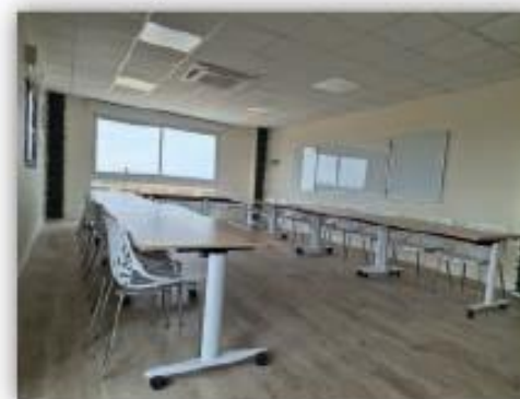
Grande salle de 52m 2 35 personnes assises \pm 5