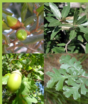
Quercus sp (Chêne)