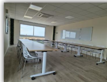
Grande salle de 52m 2 35 personnes assises \pm 5

-L'aventure «Koh Beezou» (environ 1.5 heures d'épreuves mythiques) -En tenue d'apiculteur sur les ruchers (1 heure + visite miellerie inclus 30min)