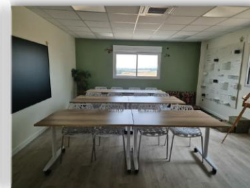
Seconde salle de 33m 2 12 personnes assises \pm 5